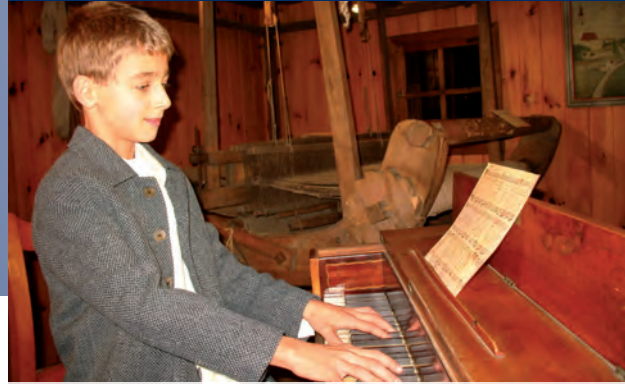
Der junge Franz Xaver Gruber am Klavier.